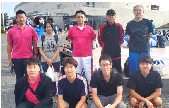
周南市選手団 全9名